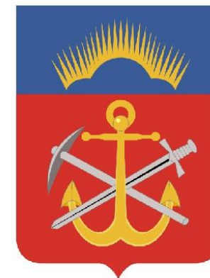
Герб Мурманской области

В 1780 году уже Екатерина II вновь решила реформировать государственную администрацию. Было образовано Вологодское наместничество из трех областей: Вологодской, Великоустюгской и Архангельской. Кольский уезд стал частью Архангельской области Вологодского наместничества.